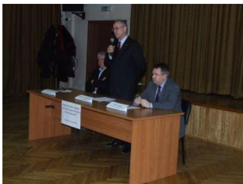
Walne Zebranie Członków dn. 08.02.2011r.

W dniu 8 lutego 2011 roku uzupełniona LSROR została przyjęta na Walnym Zebraniu Członków „Lokalnej Grupy Rybackiej Zalew Zegrzyński”.