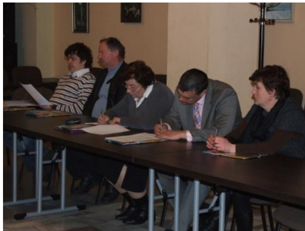
Fot. Spotkanie aktywizacyjne w GCKiS w Jabłonie, 01.02.2011r. (na fot. członkowie Komitetu LGR reprezentujący sektor rybacki)