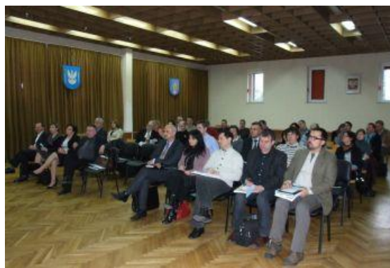
WZC "Lokalnej Grupy Rybackiej Zalew Zegrzyński", dn. 08.02.2011r.